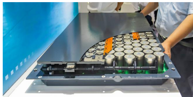
Lithium-Akku-Modul mit BMS für Elektroautos oder Energiespeicher

Als G7-Staat spielt Kanada mit seinem liberalen Wirtschaftssystem in der Liga der Industrienationen. Das Land ist über das "North American Free Trade Agreement" (NAFTA) stark in den nordamerikanischen Wirtschaftsraum eingebunden. Mit dem südlichen Nachbarn, USA, werden über 70 % des kanadischen Außenhandels abgewickelt. Die enge Verflechtung macht die Wirtschaft jedoch anfällig für konjunkturelle und anders bedingte Schwankungen in den USA. Die kanadische Regierung ist daher bestrebt, die Außenhandelsströme regional stärker zu diversifizieren und setzt dabei auf bilaterale Handelsabkommen. Vor einigen Jahren haben die führenden Bergbauunternehmen der Welt einen groß angelegten Prozess zur Erneuerung ihrer Anlagenparks eingeleitet. Forschungsinstitute schätzen, dass der globale Markt für Bergbauausrüstungen bis 2026 ein Volumen von 285,5 Milliarden Dollar erreichen wird. Dabei werden automatisierte Technologien und so genannte "intelligente"